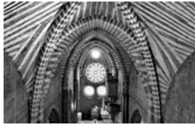
Voûte de la nef