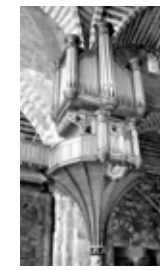
Stalles de l'abside

Grandes orgues, restauration atelier Quoirin