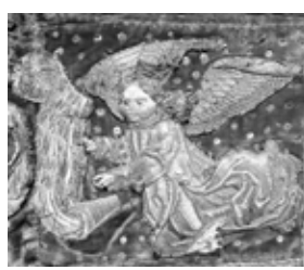
Chasuble, XV e siècle, détail, Ville d'Embrun