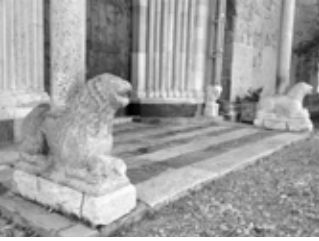
Porche du Réal, lions stylophores (portant une colonne)