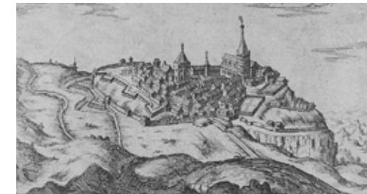
Embrun, 1652, gravure Tassin

Découvrez cette architecture si particulière, l'histoire d'un archevêché étendu et de sa cathédrale à la fresque miraculeuse !