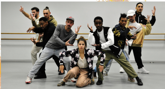
Spectacles à salle des fêtes en cas d'intempéries

Les danseurs partagent différentes techniques de hip-hop dans une pièce "tout terrain" qui les projette successivement dans les airs et vers le sol dans un esprit d'échange et de jubilation."