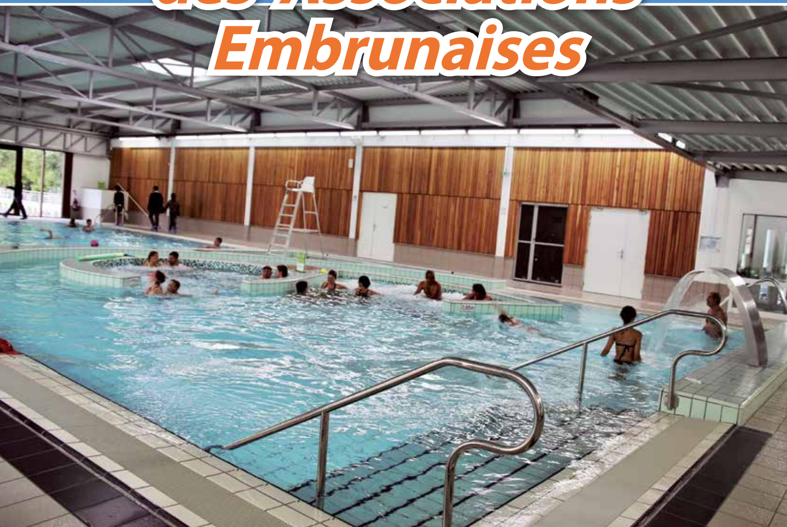
Le centre aquatique intercommunal AQUAVIVA.