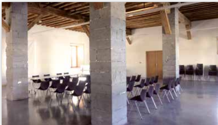
Salle de la Manutention.

La valorisation des aides matérielles apportées par la commune aux associations, le prêt des minibus, et la mise à disposition de locaux représentent environ 610 000 € par an.