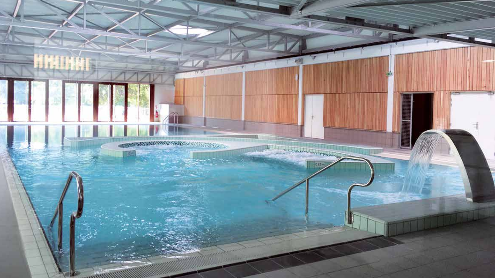
Le centre aquatique intercommunal AQUAVIVA.