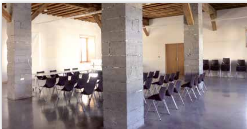
Salle de la Manutention.

La valorisation des aides matérielles apportées par la commune aux associations, le prêt des minibus, et la mise à disposition de locaux représentent environ 610 000 € par an.